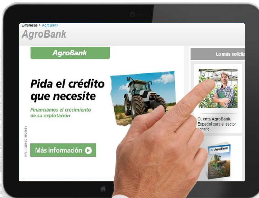
Web portal AgroBank

Smart PC con información compartida, que permite realizar la operativa comercial del gestor agrario en el lugar de trabajo de nuestros clientes.